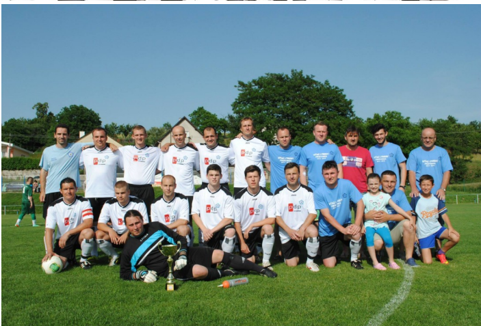
Víťzný tím I. A triedy.