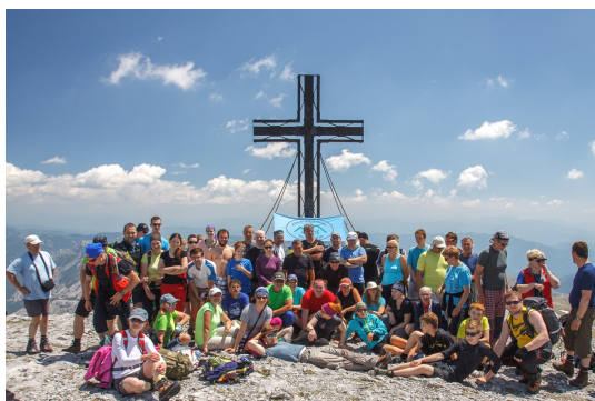
Sučianski turisti na vrchole Hochschwab.