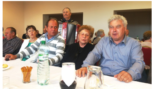
Stretnutie dôchodcov.

Naša potočná dedina sa 22. 4. prebudila do jarného rána. Deň ako každý iný. No na základe pozvania členov kultúrnej komisie spoločenská sála kultúrneho domu ožila „domovom“. Nie domovom, ktorý tvorí súhrn vecí, predmetov a zmyslových vnemov, ale aj – a azda predovšetkým – združením ľudí. Domov nemôže jestvovať bez vzťahov k iným ľuďom a musí smerovať k ustavičnému obnovovaniu medziľudských vzťahov a k pripisovaniu nového zmyslu starým vzťahom k jednotlivým ľuďom – občanom.