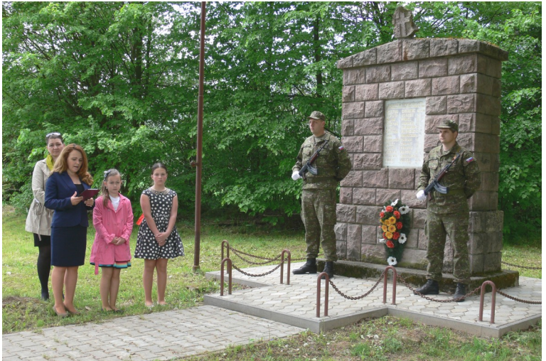
Kladenie vencov na Majeri 7. mája.