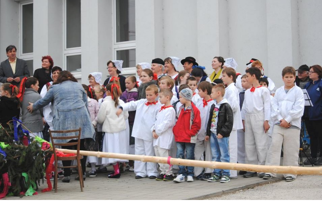
Stavanie mája. Autor: Anton Haluš.