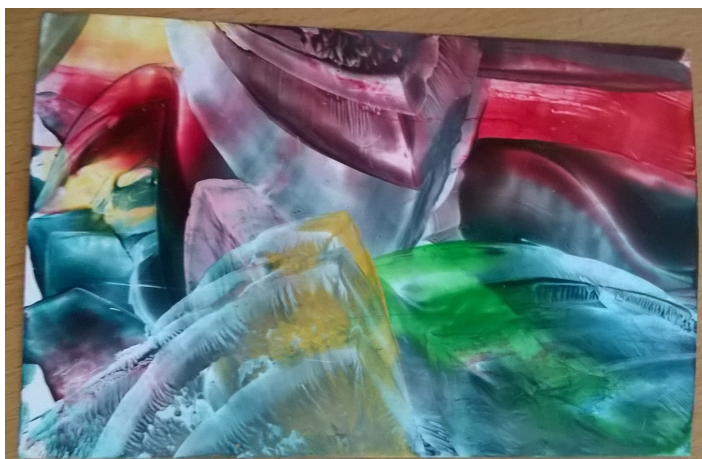
Enkaustika zo základnej školy.