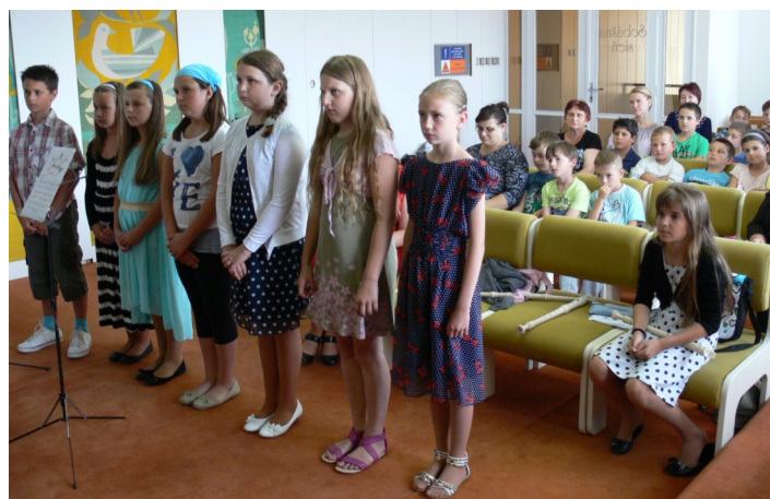
Prijatie úspešných žiakov starostom obce.