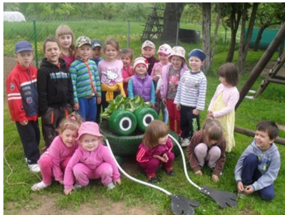
Obr. 2: Žabka z pneumatík na školskom dvore.