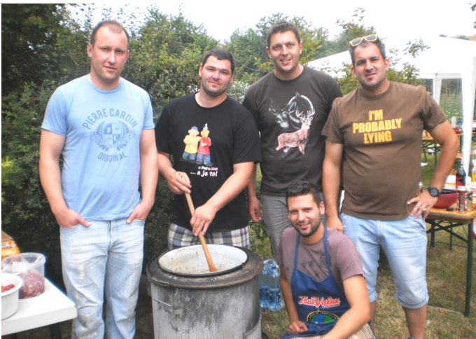
Víťazný tím vo varení gulášu. Autor: Vladimír Cvopa.

Starosta obce úprimne ďakuje všetkým občanom, ktorí aj v tomto období prispeli k rozvoju obce, prípadne sa pricinili pri organizácii podujatí. Zároveň patrí vďaka všetkým občanom, ktorí boli trpezliví pri rekonštrukcii osvetlenia v obci napriek tomu, že z toho vyplývali rôzne obmedzenia. Prístup občanov k tejto situácii bol naozaj príkladný a zaslúži si uznanie.