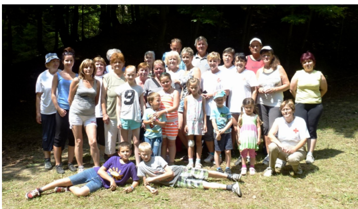
3. 7. 2015 – Výlet s miestnym Červeným krížom spojený so súťažami, opekačkou a vyzbieraním odpadu z okolia.