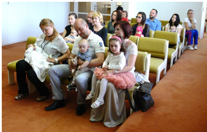
Vľavo: Uvítanie detí do života.