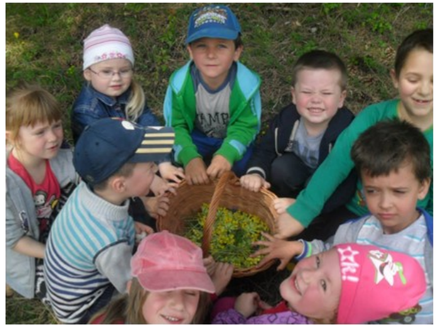
Obr. 1: Zber liečivých rastlín.

Naša materská škola je už niekoľko rokov zapojená do národného programu Škola podporujúca zdravie, zameraného na výchovu zdravého životného štýlu, ktorého jedným z hlavných cieľov je utvárať elementárne základy environmentálnej kultúry prostredníctvom pozitívneho vzťahu k prírode a k životnému prostrediu. V súčasnom období v rámci tohto programu cieľavedome pripravujeme a plánujeme rôznorodé aktivity vo vnútorných a vonkajších priestoroch našej školy. Pri príležitosti Dňa Zeme sme uskutočnili aktivity zamerané na zber liečivých rastlín (obr. č. 1), triedenie odpadu, pestovanie rastlín, ohľaduplné správanie sa v prírode, oboznamovanie sa s prírodným a odpadovým materiálom a s jeho využitím pre človeka. Nový prírastok na školskom dvore z ojazdených pneumatík (obr. č. 2) deťom pomáha objavovať a zároveň tvoriť krásu vo svojom najbližšom okolí. Po ukončení týchto aktivít deti samé navrhovali, ako by mohli pomôcť našej Zemi. Sľúbili, že budú šetriť vodou, nebudú plytvať papierom na kreslenie a budú zbierať odpad v prírode.