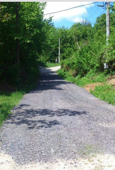
Upravená cesta v Kačarovej.