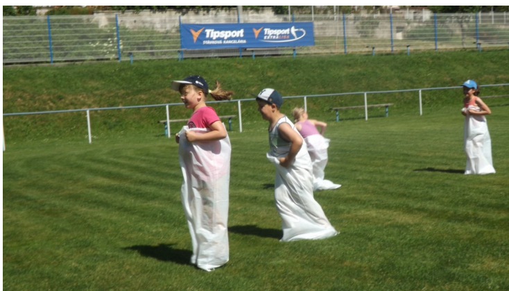
Malí pretekári na futbalovom ihrisku.