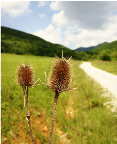
Cesta dolinou. Autor: Michal Caňo.