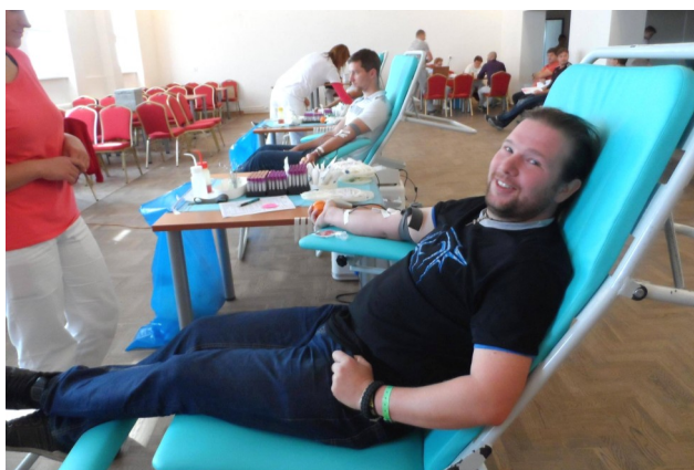
Prvodarca na odbere.

Podeľ sa o svoj život a daruj krv! Navrátilová Dana