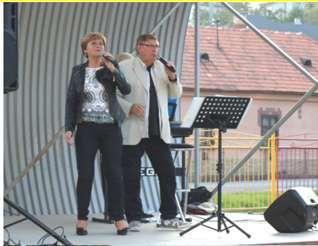
Hudobná skupina Vega na sučianskych hodoch.