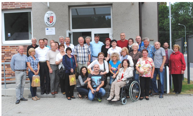
Moravsko-slovenské zoskupenie v Bohdíkove.

Dňa 19.8.2016 popoludní uskutočnil klub dôchodcov v Nitrianskych Sučanoch výlet do obce Kulhňa na rybacie hody, ktorého sa zúčastnilo štyridsaťdva našich členov.