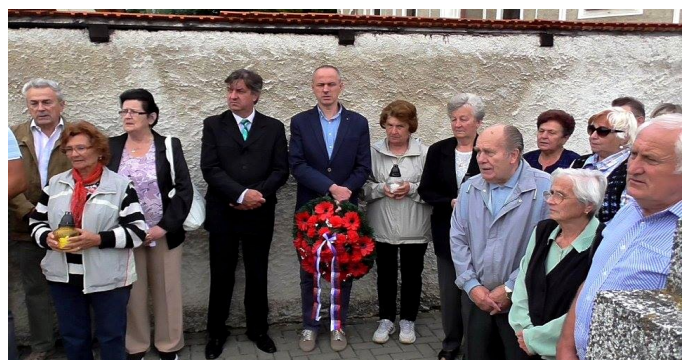
Pietna spomienka na padlých občanov na miestnom cintoríne.