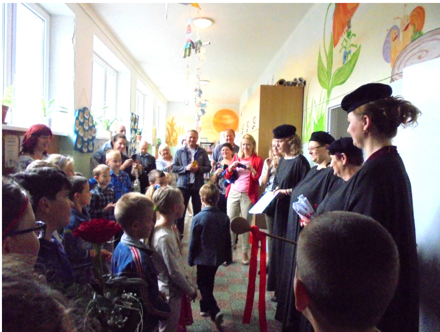
Slávnostný začiatok nového školského roka v základnej a materskej škole.