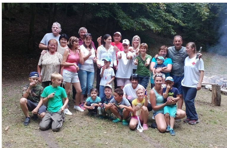
Účastníci výletu pri studničke v Červenej doline.

2. júla sa uskutočnil dedinský turnaj o pohár starostu obce, ktorého sa zúčastnili štyri tímy. Zvítazilo družstvo z Hája, druhé miesto obsadil Dolný koniec, bronz získali Chrastečky a štvrtý skončil tím Horného konca. Všetci zúčastnení si užili športové popoludnie s dobrým počasím, neskôr pri občerstvení si oddýchlí a zabavili sa.