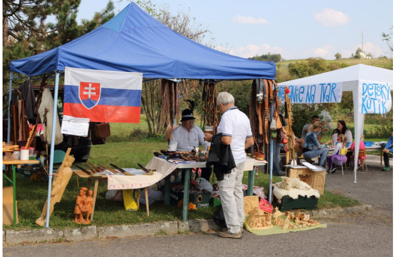
Aj ľudoví umelci mali svoje miesto na hodovej oslave.