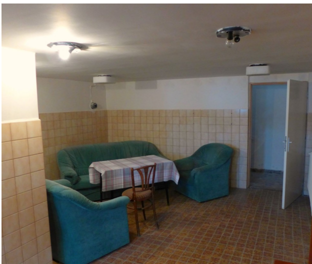
Bývalá kuchyňa prestavaná na miestnosť pre stretnutia dôchodcov, prípadne na iné aktivity.