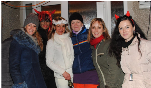
Vianočné trhy.