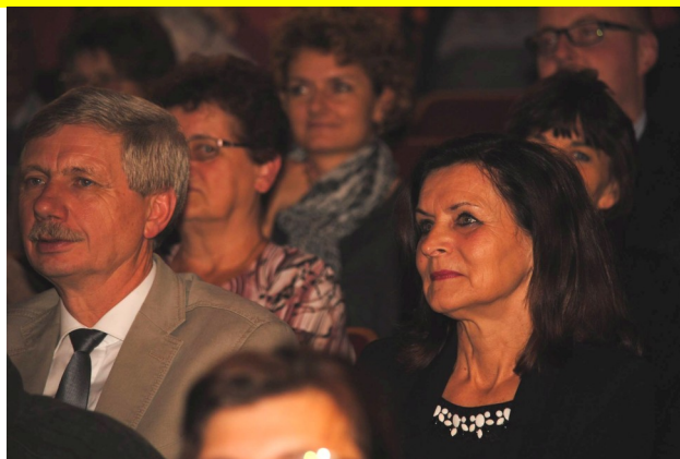
Starostovský pár z Bohdíkova.