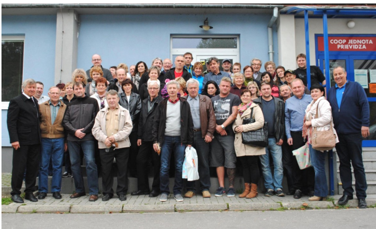
Vzácná návšteva z Bohdíkova.