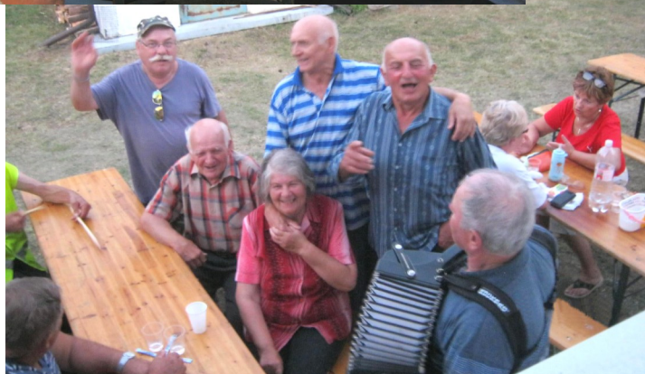
Členovia klubu počas opekačky.