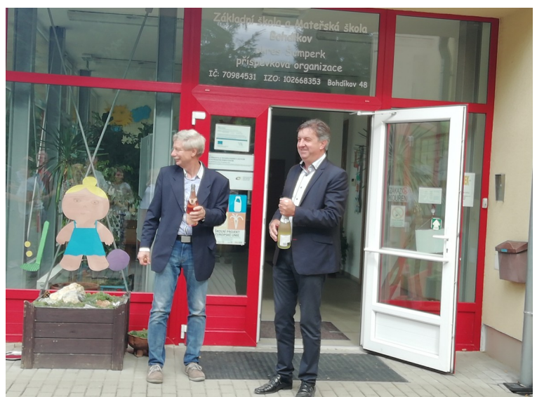
Slávnostné otvorenie telocvične v Bohdíkově. Foto: Elena Ivanovová.