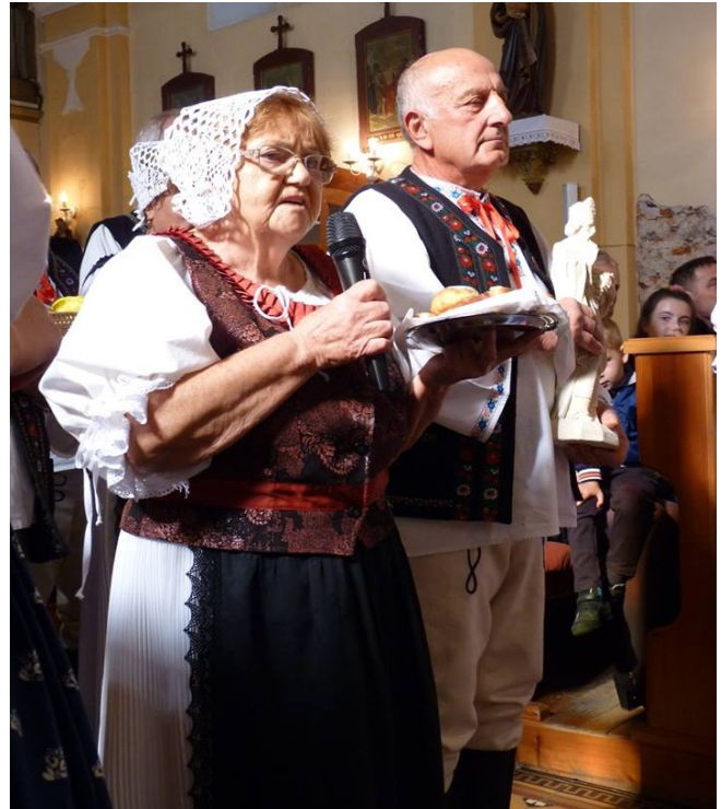
Požehnávanie úrody v kostole.