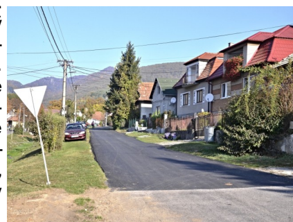
Cesta do Kobylia a Kačarovej s novým povrchom.