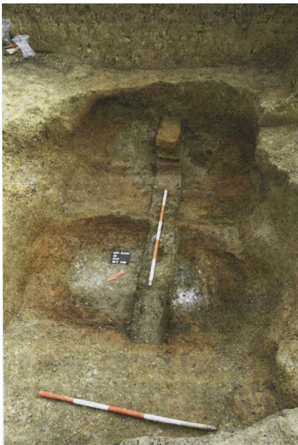
Kolmý náhľad na vypreparované estrichy včasnostredovekých pecí.

včasného stredoveku tiež poukazujú na osídlenie obce pred prvou písomnou zmienkou, pričom obývaná bola zrejme skôr východná a juhovýchodná časť obce.