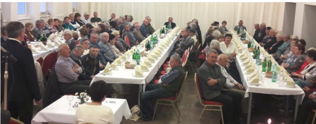
Účastníci aktívu dôchodcov v tanečnej sále kultúrneho domu.