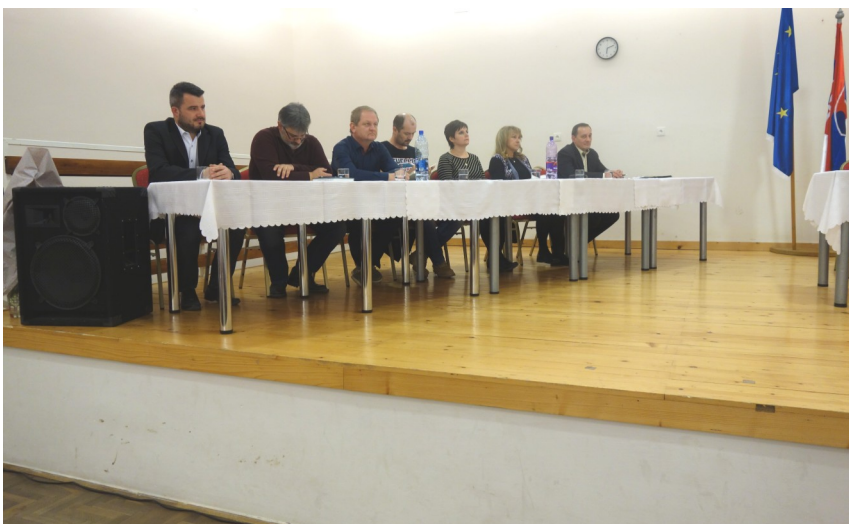
Zvolení starosta a poslanci na ustanovujúcom zastupiteľstve.