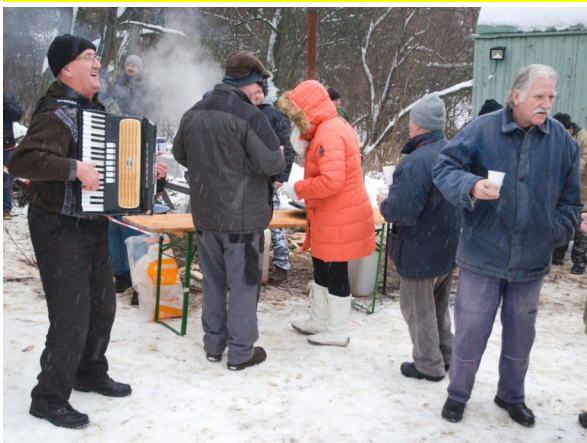
Vľavo: Veselo pri hudbe. Vpravo: Masko- vané postavy rozdávajú deťom dobrotu.